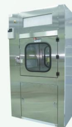
層流型 Laminar Air Flow Type