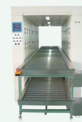
隧道式輸送除塵型 Tunnel conveyor air shower type