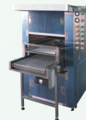
風刀式靜電除塵型 Air knife Static Elimination Type