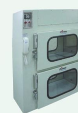
雙層傳遞型 Two Layers pass boxes type